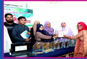
৯ম রিমি, কামারুদ্দোসা সরকারি বালিকা উচ্চ বিদ্যালয়