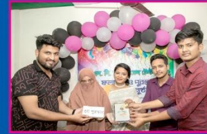
৩য় মনিরা, কামারুদ্দোসা সরকারি বালিকা উচ্চ বিদ্যালয়