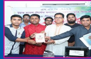
১০ম শিখন, নারিন্দা সরকারি উচ্চ বিদ্যালয়