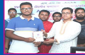
৭ম রাবিব, মতিঝিল মডেল কুল এন্ড কলেজ