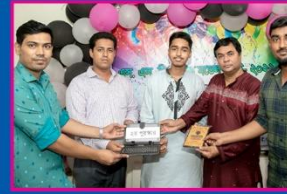
২য় হুদন, তারিক, মতিঝিল মডেল কুল এন্ড কলেজ