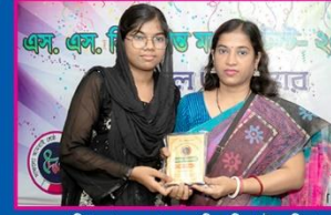
১০ম সাদিয়া কামারুদ্দোসা সরকারি বালিকা উচ্চ বিদ্যালয়