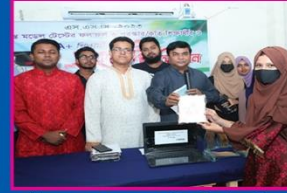
৬ষ্ঠ উজমা, কামারুদ্দোসা সরকারি বালিকা উচ্চ বিদ্যালয়