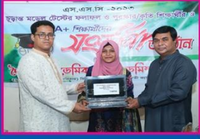
১ম সাদিয়া, কামারুদ্দোসা সরকারি বালিকা উচ্চ বিদ্যালয়