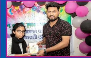
৮ম জেরিন, কামারুদ্দোসা সরকারি বালিকা উচ্চ বিদ্যালয়