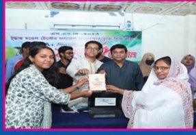
২য় হানি, নিউ গভঃ বালিকা উচ্চ বিদ্যালয়