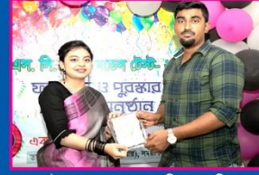
৯ম মাইমুনা, শেরে বাংলা বালিকা মহাবিদ্যালয়