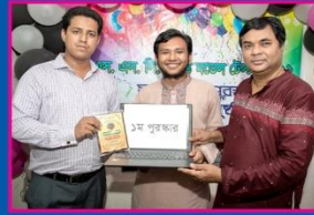
১ম হুদন, রাভিন, মতিঝিল সরকারি বালক উচ্চ বিদ্যালয়