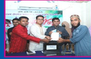
৪র্থ কাউসার, নারিন্দা সরকারি উচ্চ বিদ্যালয়