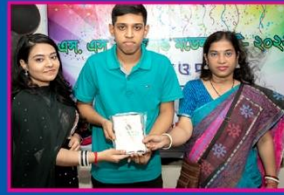
৫ম সোয়েব, মতিঝিল সরকারি বালক উচ্চ বিদ্যালয়