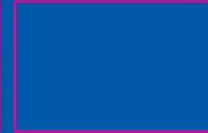
৪র্থ আকলিয়া, শেরে বাংলা বালিকা মহাবিদ্যালয়