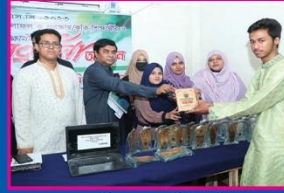
৫ম হুদয়, নারিন্দা সরকারি উচ্চ বিদ্যালয়