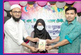
৬ষ্ঠ লানিয়া, কামারুদ্দোসা সরকারি বালিকা উচ্চ বিদ্যালয়