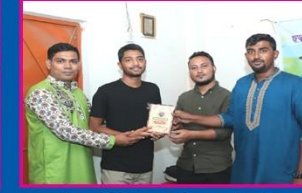
৮ম মাহিম, মতিঝিল সরকারি বালক উচ্চ বিদ্যালয়