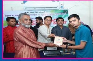
৩য় তাসনিমুল, মতিঝিল সরকারি বালক উচ্চ বিদ্যালয়